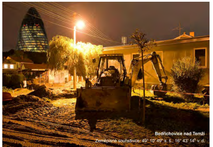
Bedřichovice nad Temží Zeměpisné souřadnice: 49° 10' 49" s. š., 16° 43' 14" v. d.