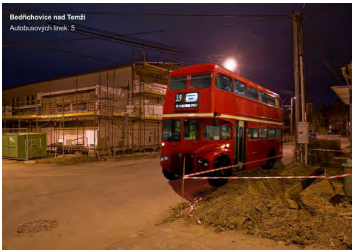
Bedřichovice nad Temží Autobusových linek: 5