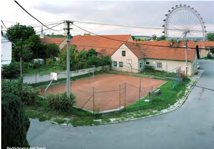
Bedřichovice nad Temží