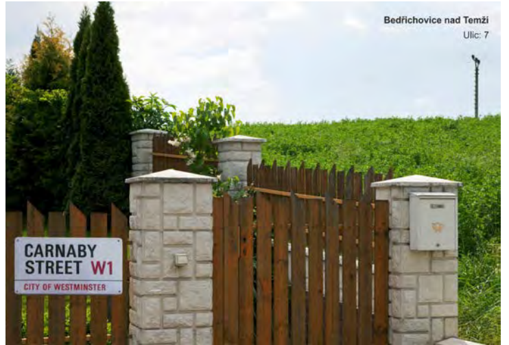
Bedřichovice nad Temží Ulic: 7